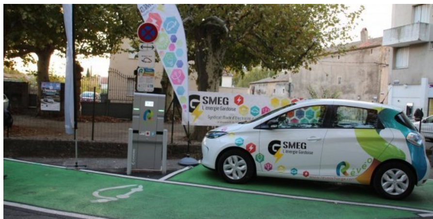
Les véhicules ont été rechargés sur les bornes installées place Pierre-Boulot.

Recommander Partager 3 personnes recommandent ça. Inscription pour voir ce que vos amis recommandent.