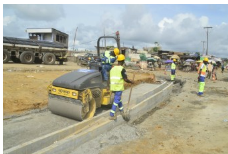
( http://www.connexiontt.com/cameroun-profite-de-coupe-dafrique-nations-ameliorer-transport/ )

( http://www.connexiontt.com/ferroviaire-double-sauvetage-ligne-cevennes/ )