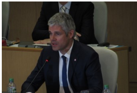
( http://www.connexiontt.com/laurent-wauquiez-veut-faire-jouer-preference-regionale-ferroviaire/ )

🕒 11 JUILLET 2016 📄 ACTUALITES (HTTP://WWW.CONNEXIONTT.COM/CATEGORY/TYPES/ACTU, , LES COLLECTIVITÉS (HTTP://WWW.CONNEXIONTT.COM/FAMILLE/LES-COLLECTIVITES/), LES INDUSTRIELS (HTTP://WWW.CONNEXIONTT.COM/FAMILLE/LES-INDUSTRIELS/), LES OPÉRATEURS (HTTP://WWW.CONNEXIONTT.COM/FAMILLE/LES-OPERATEURS/))