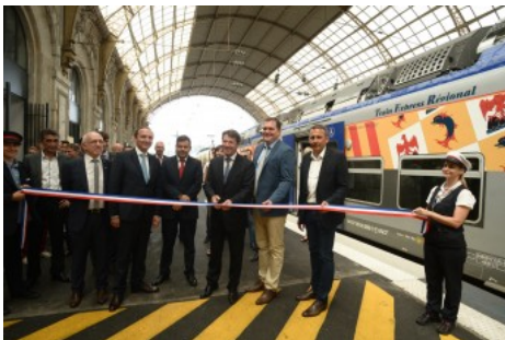
( http://www.connexiontt.com/regio-2n-deploies-laxe-grasse-vintimille/ )

ARTICLES SIMILAIRES ( http://www.connexiontt.com/lyon-ville-phare-de-lelectro-mobilite/print/ )