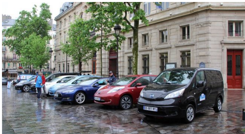
( http://www.automobile-propre.com/wp-content/uploads/2016/05/fet-2016-depart-vehicules-electriques.jpg )

Plus d'information: www.france-electrique-tour.com ( http://www.france-electrique-tour.com )