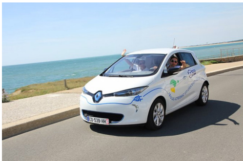
( http://www.automobile-propre.com/wp-content/uploads/2016/03/vehicule-electrique-addictif.jpg )

19 Mar 2017 & Michaël TORREGROSSA ( http://www.automobile-propre.com/author/miki006/ ) Voiture électrique ( http://www.automobile-propre.com/voiture-electrique/ ) 5 commentaires ( http://www.automobile-propre.com/tour-vehicules-electriques-calendrier-2017/#c )