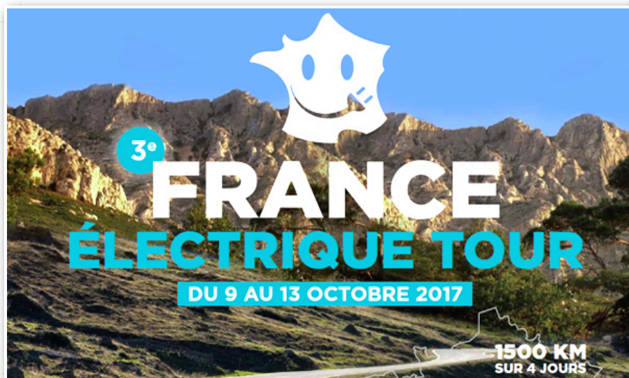
France électrique Tour 2017 : Les inscriptions sont ouvertes

Posté le 21/07/2017 à 09:00 par Philippe Schwoerer - Lu 2274 fois - 4 commentaires